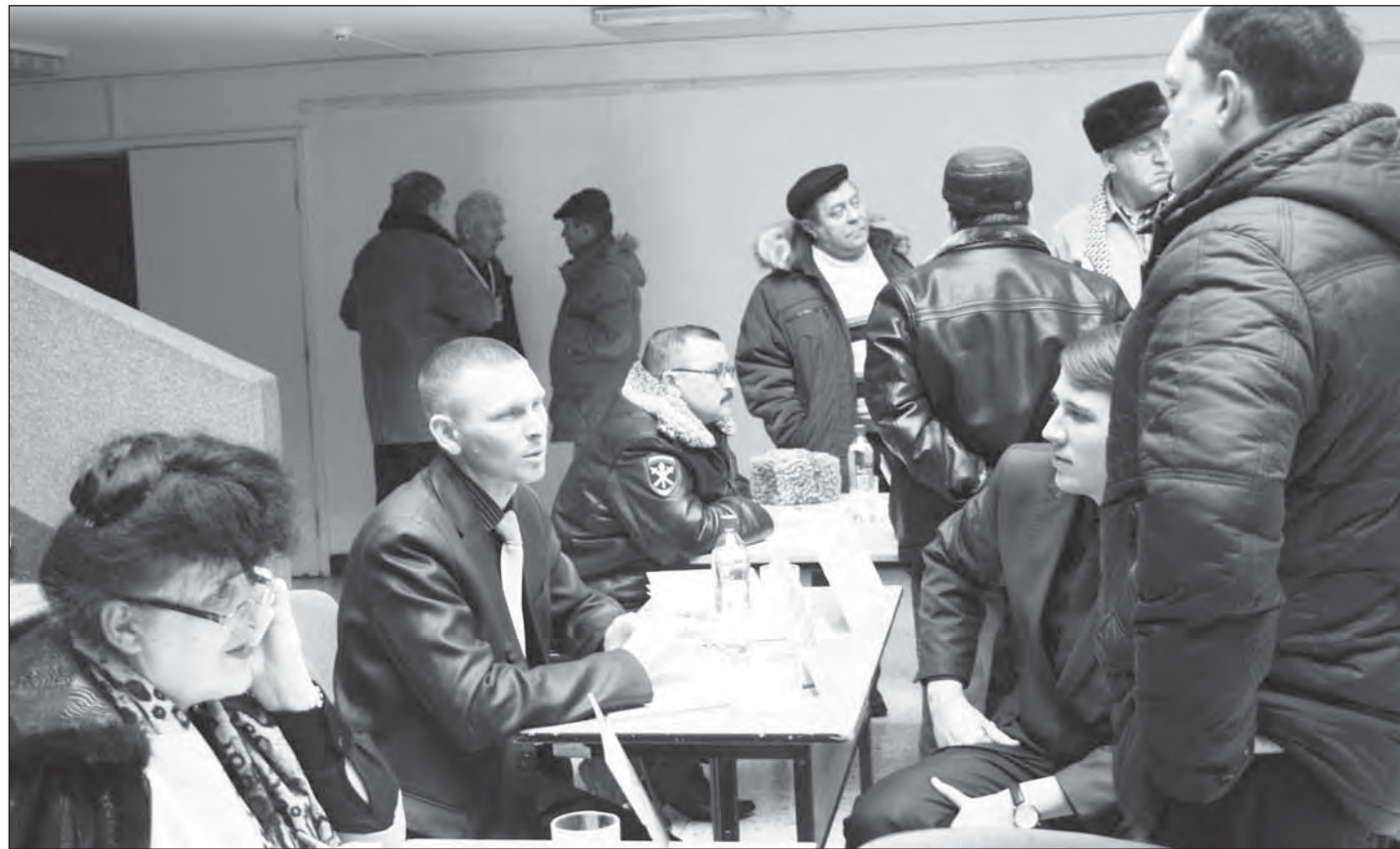
Личный приём граждан позволил снять множество вопросов, с которыми пришли на сход жители военного городка

На встрече с районной и городской администрациями жители военного городка затронули самые разные темы